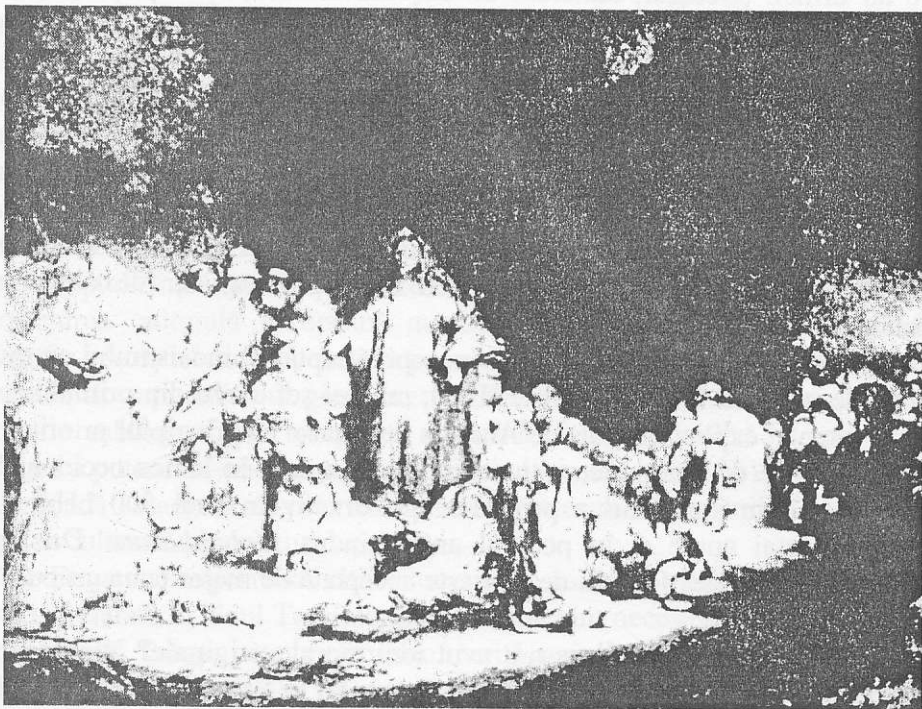
Gravura Piesa de 100 de guldeni a lui Rembrandt, reprezentându-l pe Hristos predicând.

practică și nici nu se așteaptă ca semenii lor să adopte altă atitudine. Prin urmare, cea mai originală învățătură a lui Iisus rămâne o sugestie interesantă, dar, în esență, neaplicată în viața de zi cu zi.